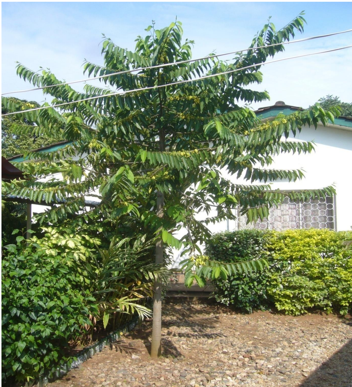
Figure 2: Un des trois ylang-ylanguiers plantés au 83 Chaussée Prince Louis Rwagasore, commune Rohero, Mairie de Bujumbura. En deux ans, il a déjà atteint 3 mètres avec une floraison suffisante.