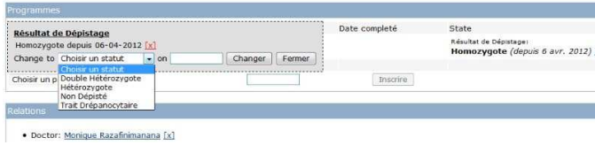
Figure 3 : Interface d'identification de la spécificité des paramètres génétiques de la Drépanocytose

Cinq médecins référents du programme SOLIMAD en faveur de la prise en charge de la drépanocytose à Madagascar sont équipés d'un ordinateur portable et d'une connexion internet 3G+ pour pouvoir participer à ce réseau. Ils ont été formés sur l'utilisation du logiciel et participent activement aux saisies des résultats des dépistages et du dossier clinique des patients dans leurs régions respectives. Seules les données cliniques des patients homozygotes SS qui reviennent en consultation sont enregistrées dans le système.