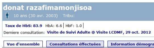
Figure 2: Aperçu des valeurs du dépistage par l'électrophorèse de l'hémoglobine

Les valeurs d'Hb S, Hb A et Hb F saisies dans la fiche de dépistage y sont affichées automatiquement. Ces valeurs exprimées en pourcentage permettront au médecin traitant de connaître le statut hémoglobinique homozygote SS, double hétérozygote SC ou hétérozygote AS corrélé aux manifestations cliniques du patient.