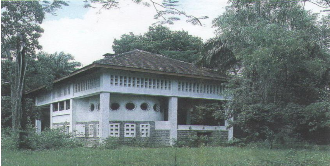
Photo n°8 : Un des bâtiments du Centre de recherche ethnologique de la réserve forestière, l'institut d'études centrafricaines qui deviendra (ORSTOM).