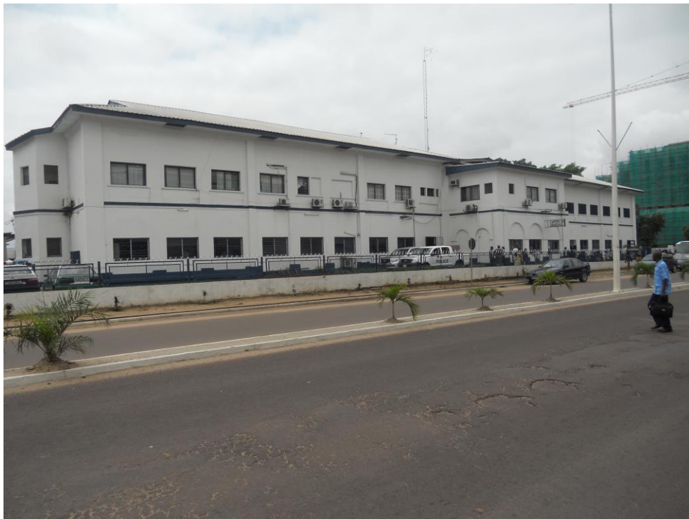
Photo n°3 : L'ancien bâtiment de l'hôpital général de Brazzaville, actuel Commissariat central de police.

Cet hôpital se situait dans les bâtiments de l'actuel commissariat central de police y compris toute la zone abritant le ministère de la Santé. 34