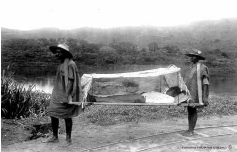
Photo n°7 : Transport d'un malade atteint de la maladie du sommeil par le personnel indigène.