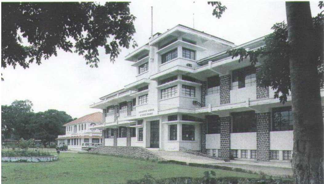
Photo n°6 : Bâtiments de l'Institut Pasteur de Brazzaville, à l'arrière plan est celui de 1906 rénové en 1932 et à l'aile droite construit en 1932- 1945 achevée en 1948.

médicales comme une activité entrant totalement dans les missions attribuées aux médecins. L'importance d'un service de santé mobile réside dans le fait qu'elle devait réaliser des tournées régulières auprès des populations pour soigner les malades, rechercher les causes de décès, dépister les maladies épidémiques, faire des vaccinations et, enfin, de donner des conseils d'hygiène.