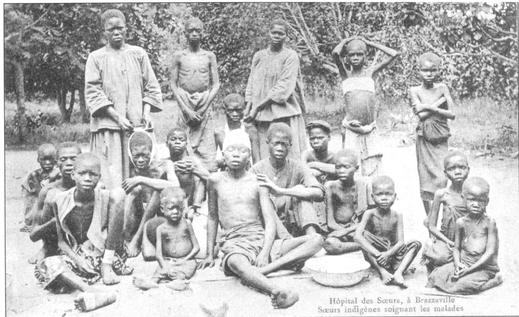
Photo n°1 : Personnes atteintes de la maladie du sommeil soignées à l'hôpital des sœurs de Saint Joseph de Cluny de Brazzaville.