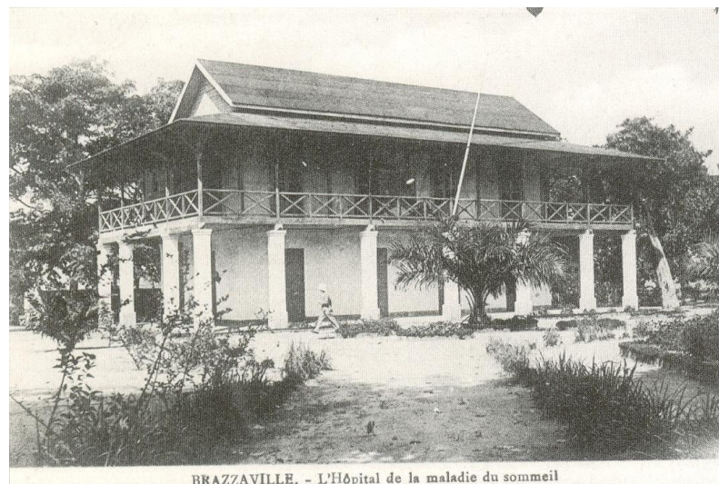
Photo n°2 : Le premier bâtiment de l'Institut Pasteur construit en 1906.