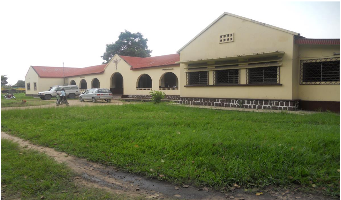
Photo n°4 : Dispensaire adulte de Bacongo actuel Centre de Santé Intégré « Bissita ». 36

Le dispensaire de Bacongo et celui de Poto-Poto faisaient également partie de ces organes centraux. Ils furent construits en 1913. 35 A ces dispensaires furent adjoints les centres de puériculture où étaient administrés des soins pédiatriques. Le centre de puériculture de Bacongo « Edouard Renard » appelé communément le « dispensaire de madame » était implanté au quartier Dahomey. Le deuxième, c'est le dispensaire adulte communément appelé « Bissita » sur l'avenue Savorgnan de Brazza.