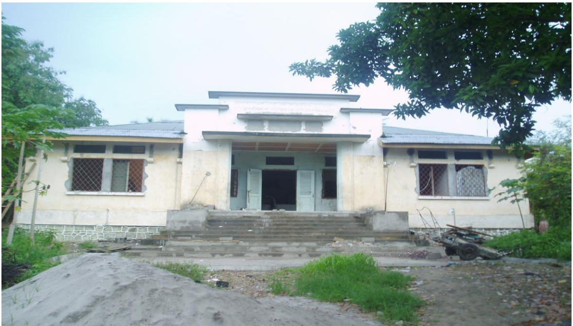
Photo n°5 : Dispensaire de puériculture de Poto-poto « Lucienne Renard », actuelle Direction Générale de la médecine traditionnelle, bâtiment en pleine rénovation.

en face de l'actuelle école des filles de Poto-Poto, sur la rue Dispensaire derrière le marché de Poto-Poto. 37 Le second était le centre de puériculture « Lucienne Renard », qui se trouve en face de l'école de la Mfoa , appelé par les congolais Mayi ya mupé . 38 Il abrite aujourd'hui le siège de la Direction Générale de la Médecine Traditionnelle. 39