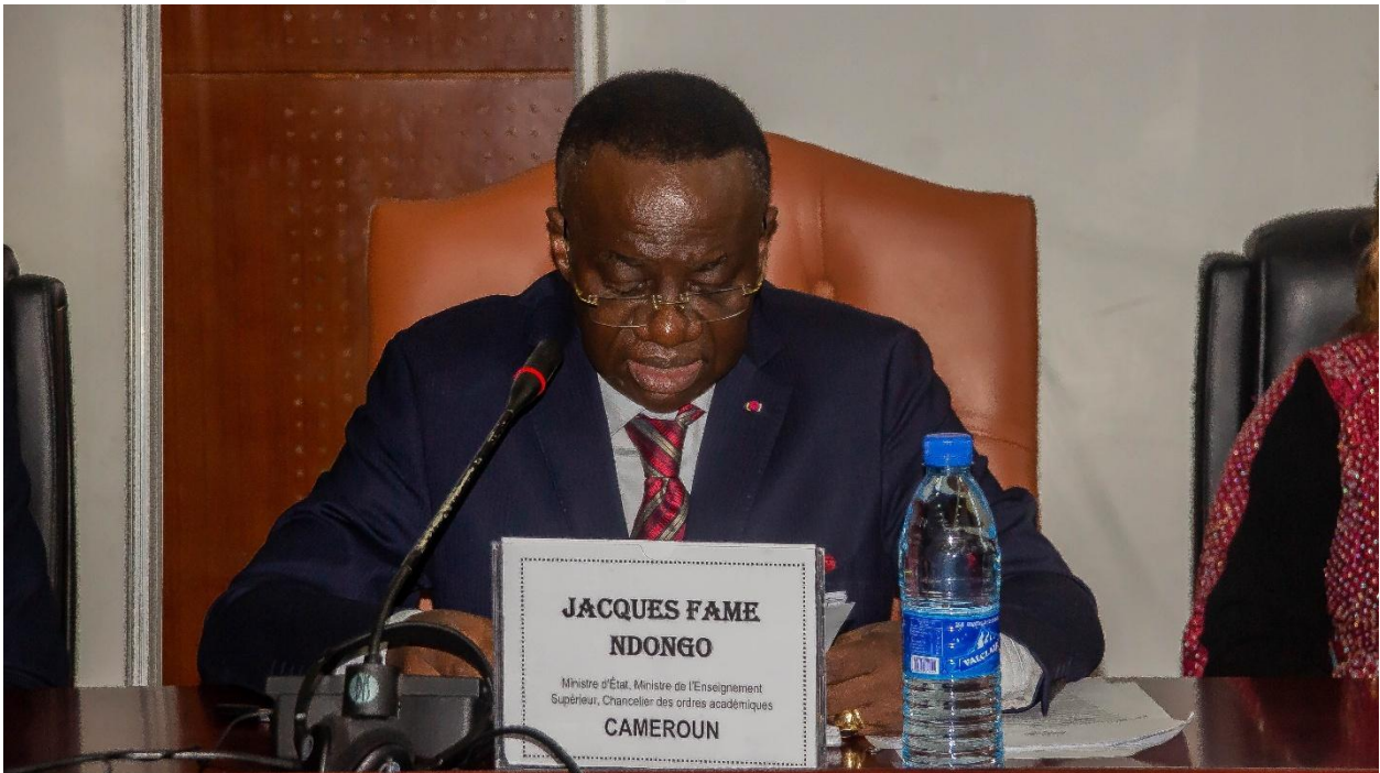
Professeur Jacques FAME NDONGO, Ministre d'Etat, Ministre de l'Enseignement Supérieur, Chancelier des Ordres Académiques